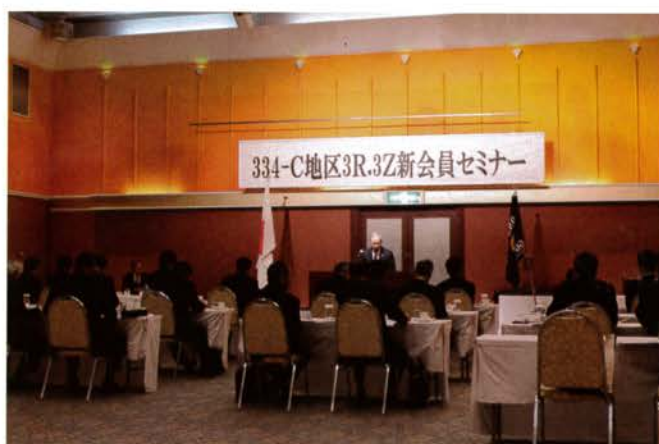
3Z5クラブから今年も多くの新会員が参加しました

会員個人にとっては、クラブ入会したときの印象が原点として残るのではないのでしょうか？ライオンズバッジの授与、ライオンズの誓い、そして初めて参加する他クラブとの合同開催される新入会員セミナーで、初めてライオンズ精神を学びました。