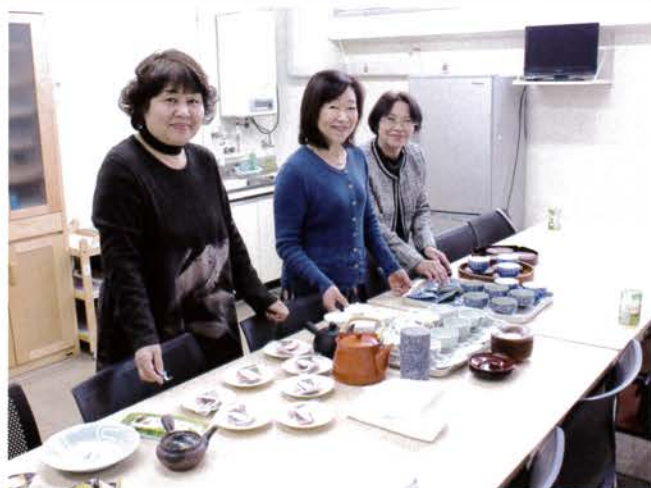
ライオンレディーによる湯茶接待ありがとうございます