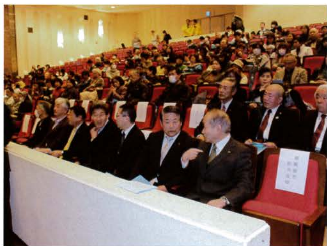
来賓も着席され会場準備は整いました