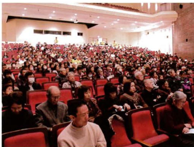
会場には多くの市民がご来場されました