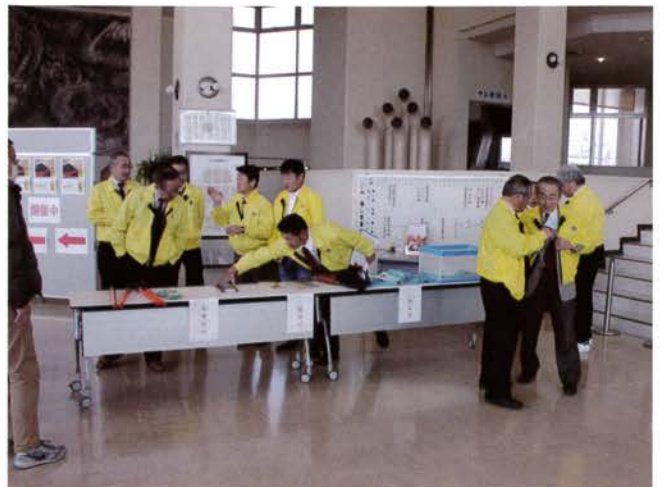
大勢のお客様を迎える受付準備も大忙しです