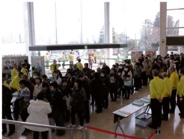
開演前にはホールはご覧のとおり大混雑