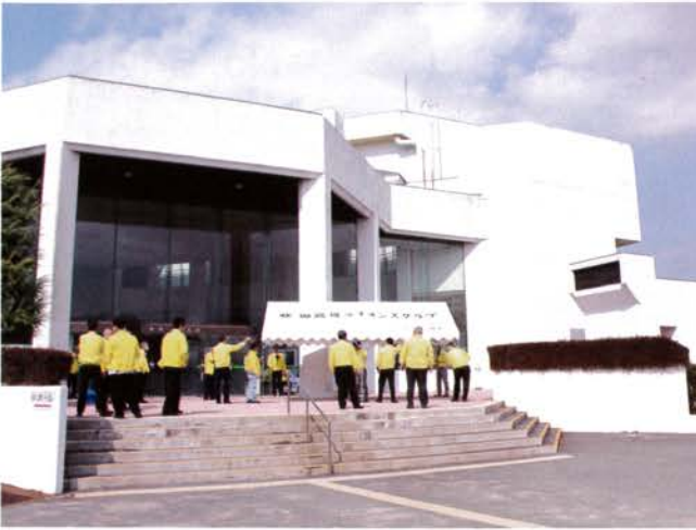
記念事業のひとつとして新調したテント